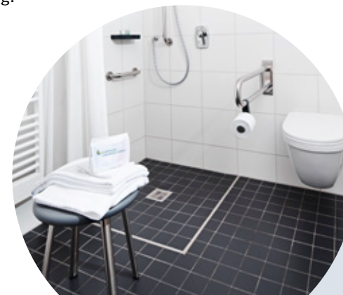
Badezimmer Station Rötteln